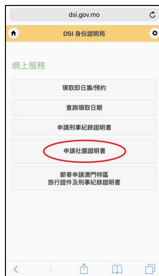
申請人點擊“申請社團證明書”以進入網上申請系統（手機網頁）