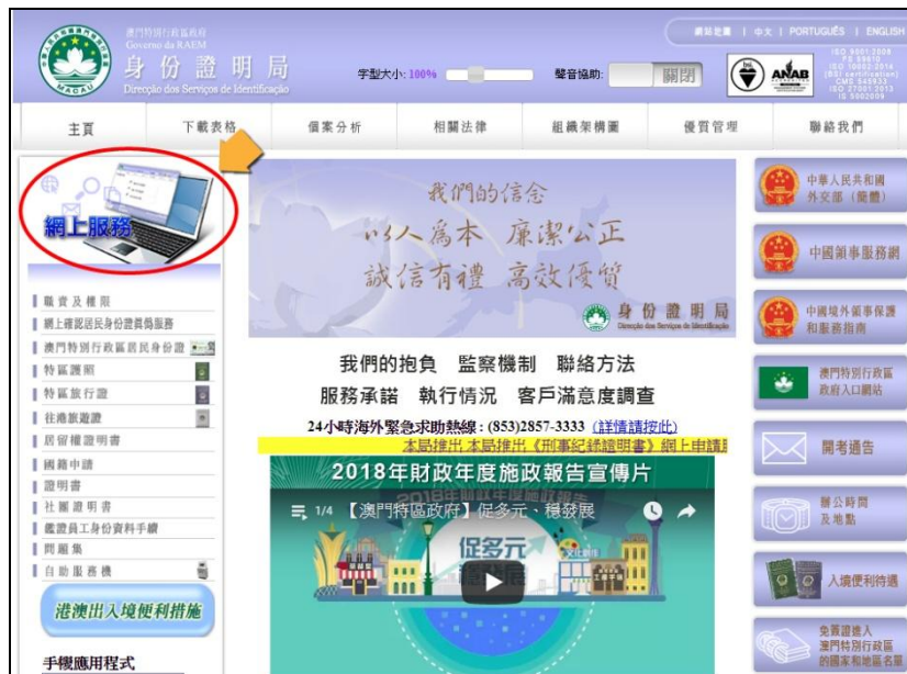
身份證明局“網上服務”專區（桌面網頁）